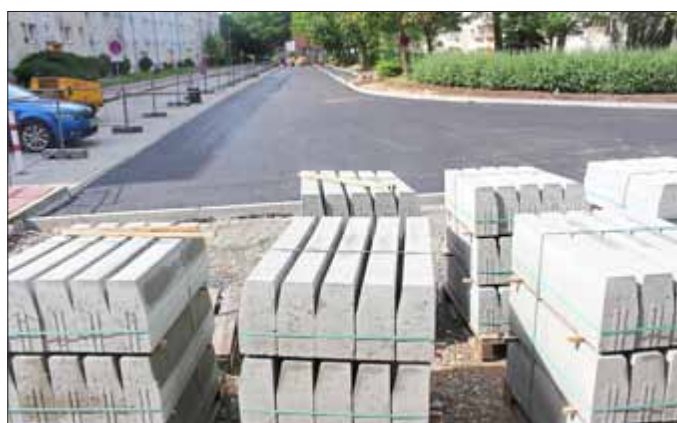
Die Straße von der Einfahrt Aldi bis Haus-Nr. 34 ist fertiggestellt.