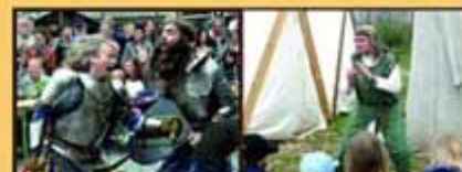
z.B. Replikat aus der Dreifaltigkeit „Schloß“ (Raben-Waldenberg)

Hört her ihr lieben Leut, tretet ein in die faszinierende Welt des Mittelalters. Hier seht ihr Händler und Handwerker, fesselnde Märchen und aufregende Schwertkämpfe. Auch ein historisches Lagerleben und ein mittelalterliches Karussell sind am Platze. An unserer Taberne und Bräterey kommt das leibliche Wohl nicht zu kurz. Also kommet in Scharen und erlebt die Zeit des Mittelalters hautnah.