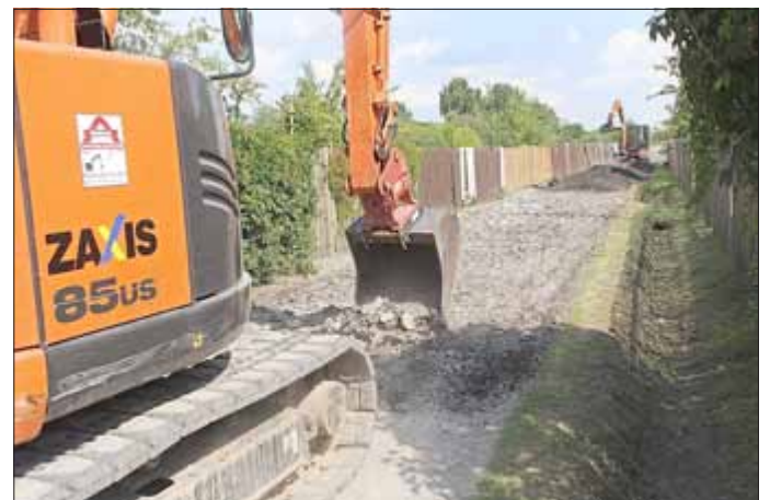
Mit einem Bagger wurde die Oberfläche aufgerissen, mit Bitumenfräsgerät vermisch und festgewalzt.

Nun steht die 100-Jahr-Feier vor der Tür und es werden viele Gäste erwartet. Somit hat die Stadt Hermsdorf auf der Haushaltsstelle der Straßenwerterhaltung einen Belag eingestellt, um die Qualität des Weges wesentlich zu verbessern.