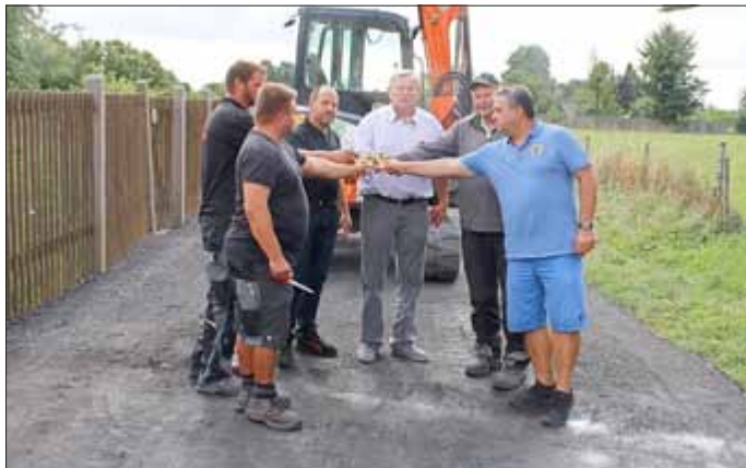
Und damit die Straße recht lange hält wurde mit einem Glas Sekt angestoßen.

Nun können die Gäste kommen, es ist ein buntes Programm vorbereitet und es ist wie immer ausreichend für Essen und Trinken gesorgt.