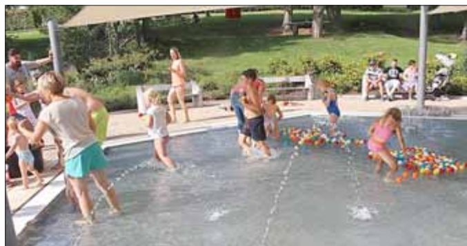
Im Kleinkinderbecken wurden die Jüngsten mit bunten Tennisbällen beschäftigt, was ihnen sehr viel Freude bereitet hat.

Im Laufe des Festes hat sich die Teilnehmerzahl deutlich erhöht. Die Stadt wird mit den Bäderbetrieben das Fest auswerten - der Termin wird geprüft, das Badfest für Erwachsene bis Abend erweitern, eine Disco einbeziehen, den Imbissbetreiber einbeziehen usw.