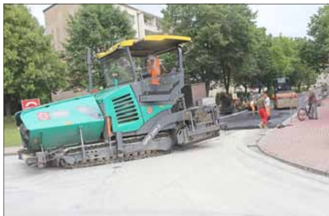
Am 27. Juli wurde auf dem 1. Bauteil die Asphalt-Deckschicht aufgebracht.

Mit der Straße in der Waldsiedlung von Hausnummer 34 bis 58 wird das letzte Stück Straße dieses Wohngebietes saniert. Geplant wurde die Sanierung der Straße, die Erneuerung des Gehweges und der Parkstellflächen sowie die Erneuerung der Straßenbeleuchtung, alles Flächen und Grundstücke die der Stadt gehören. Der Großvermieter TAG kann sich mit der Sanierung der Zuwegung zu den Hauseingängen leider nicht beteiligen, da er erheblichen Finanzbedarf bei der Sanierung des Grünstädter Platzes 1 und nun neu bei der Sanierung und Umbau des Grünstädter Platzes 2-7 hat.