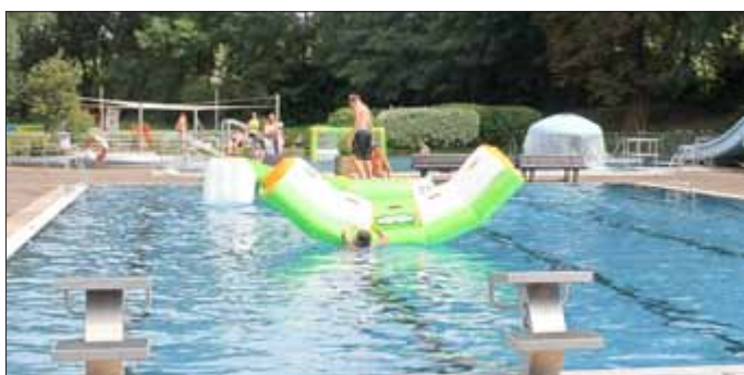
Die Animatoren hatten aus Jena zahlreiche aufblasbare Figuren mitgebracht, auf den sich die Kinder im Schwimmbecken tummeln konnten.

In den zwischen der Stadt Hermsdorf und der Jenaer Freizeit- und Bäder GmbH im Frühjahr abgeschlossenen langfristigen Betreibervertrag für das Freibad Hermsdorf ist auch ein Badfest fest verankert. Somit wurde von den Jenaer Bäderbetrieben nach vier Jahren Abstinenz für den 23. Juli ein Kinderfest geplant. Die Animatoren hatten sich große Mühe gegeben, ein abwechslungsreiches Programm zu organisieren. Die Beteiligung der Hermsdorfer war am Anfang eher verhalten, Bäderbetriebe und Stadt hatten mehr Gäste erwartet. Am Wetter kann es nicht gelegen haben, es war Badewetter. An der Werbung auch nicht, das Badfest war mehrfach in der Presse und durch Plakate angekündigt. Vielleicht waren die Hermsdorfer einfach nur überrascht, dass es wieder ein Badfest gibt.