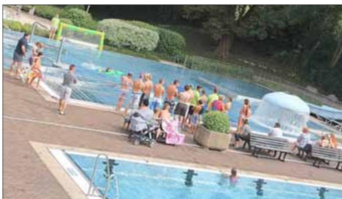
Im Erlebnisbecken wurde ein Krokodilschwimmen angeboten, wo die Teilnehmer auch kleine Preise erhielten.