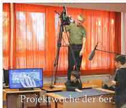
Projektwoche der 6er