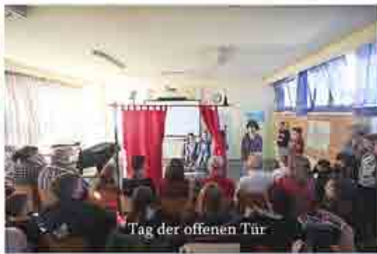
Tag der offenen Tür