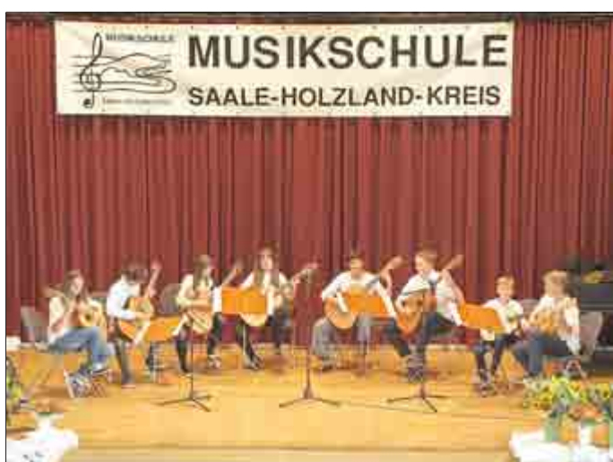
Das Gitarrenensemble der Saale-Holzland-Kreismusikschule gestaltete drei Stücke, unter anderem Jimmis Techno.