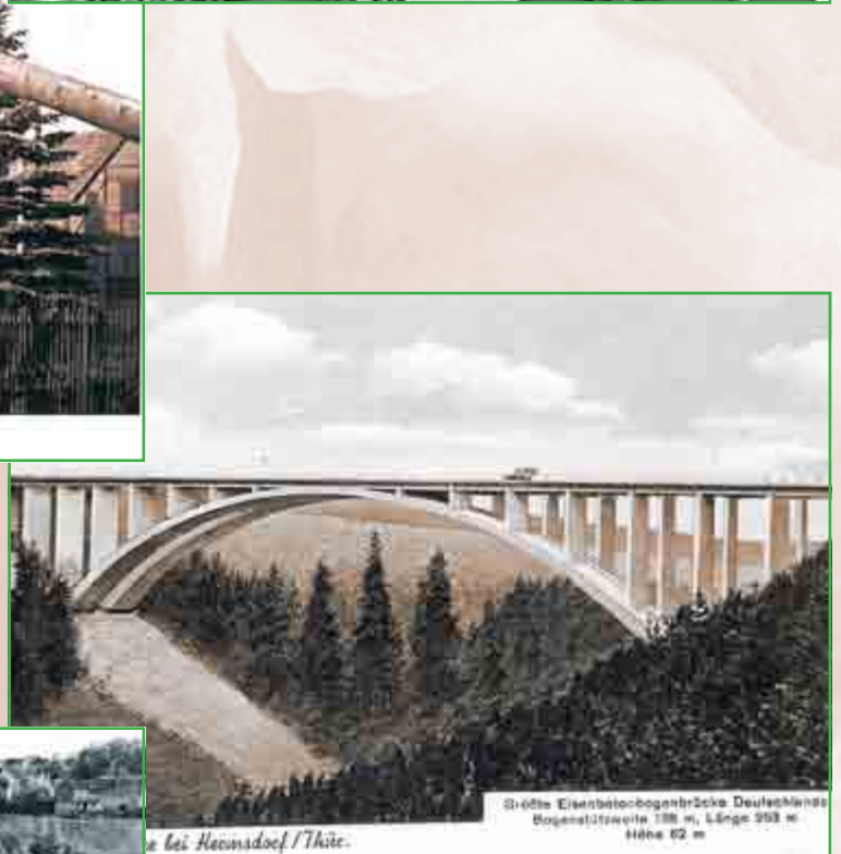
Brücke Eisenbetonbogenbrücke Deulshaus Bogenstützweite 138 m, Länge 263 m Höhe 62 m bei Hermsdorf/Thür.