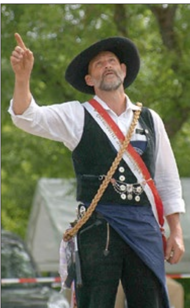
Richtmeister gibt Anweisungen

Hoffen wir alle auf ein friedliches und sonniges Maibaumsetzen 2023. Wir freuen uns auf Sie!