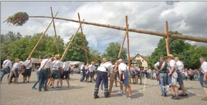
Bei der Arbeit. In diesem Winkel ist er noch sehr schwer.