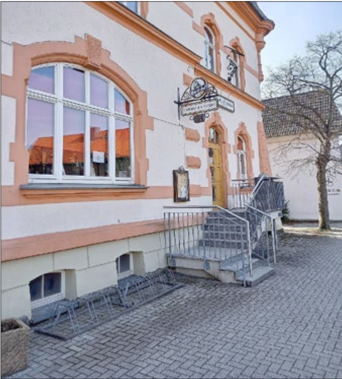
Foto: Außenansicht Rathaus - Restauranteingang

Zur CERAMICS 2023 | 98. DKG Jahrestagung begrüßten wir vom 27. - 30. März 2023 über 300 Keramiker aus ganz Europa in Jena sowie am Hightech-Standort Hermsdorf. In diesem Jahr fand die CERAMICS erstmalig an zwei Standorten statt, um die Hermsdorfer Industrieunternehmen stärker einzubinden. Neben der Veranstaltung an der Ernst-Abbe-Hochschule Jena gab es in Hermsdorf ein ausführliches Programm unter Einbindung der Campus Unternehmen. Insbesondere die Exkursionen in die Mitgliedsunternehmen des Campus erfreuten sich großer Beliebtheit und zahlreicher Teilnehmer.