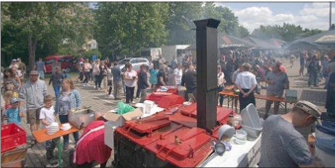
Deftiges aus der Gulaschkanone